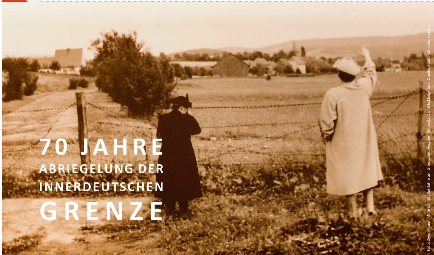
Foto: Zwei Frauen Mitte der 1950er Jahre am Grenzzaun zwischen Duderstadt und Ecklingerode.

GRENZLANDMUSEUM EICHSFELD BORDERLANDMUSEUM EICHSFELD