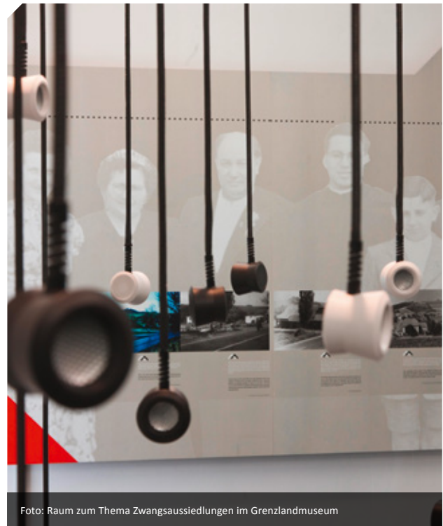
Foto: Raum zum Thema Zwangsaussiedlungen im Grenzlandmuseum

Vor der Veranstaltung wird um 17 Uhr eine Führung mit einem thematischen Schwerpunkt auf das DDR-Grenzgebiet durch die Ausstellung des Grenzlandmuseums angeboten.